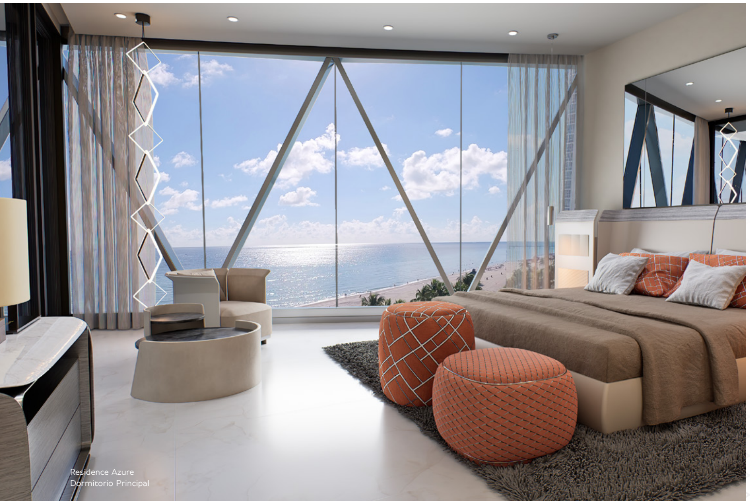
Residence Azure Dormitorio Principal

*Los servicios a la carta se reservan con el conserje de estilo de vida y son abonados directamente por los residentes