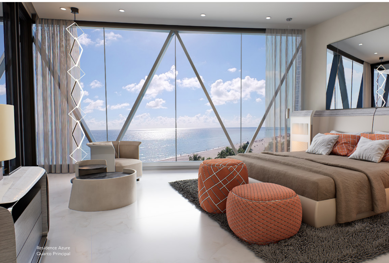
Residence Azure Quarto Principal